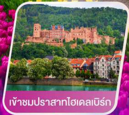
เข้าชมปราสาทไฮเดิลเบิร์ก