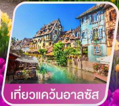
เที่ยวแคว้นอาลซัส