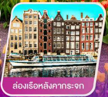
ล่องเรือหลังคากระຈก