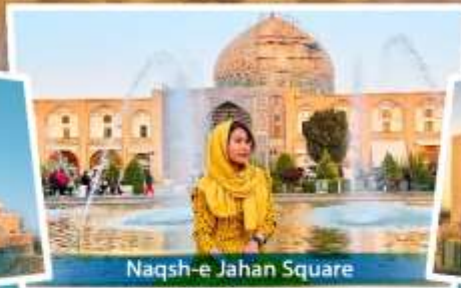
Naqsh-e Jahan Square