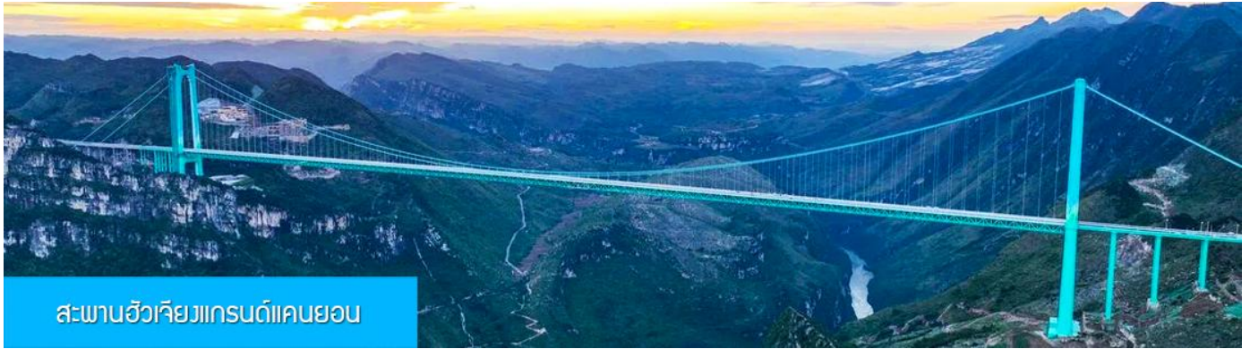
สะพานฮัวเจียงแกรนด์แคนยอน

รับประทานอาหารเช้า ณ ภัตตาคาร (มื้อที่ 7)