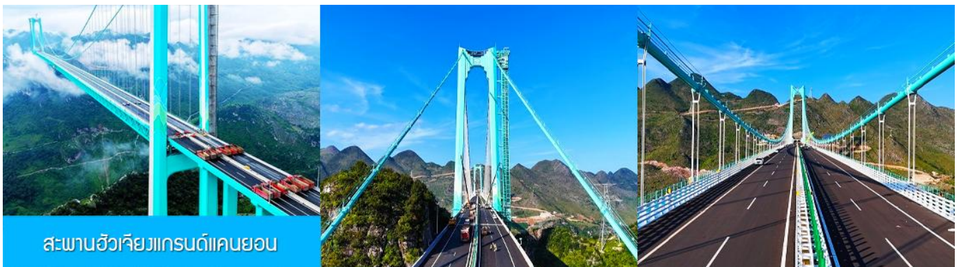
สะพานฮัวเจียงแกรนด์แคนยอน