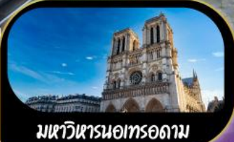
มหาวิหารนอทรอดาม