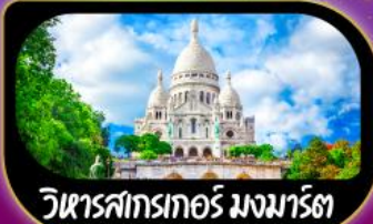
วิหารสกรเทอร์ มงมาร์ต