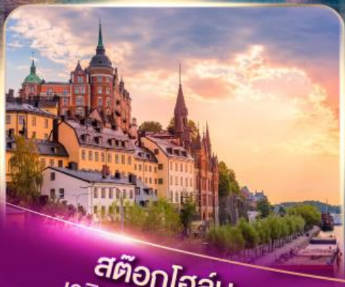
สต็อกโฮล์ม เวนิสแห่งยุโรปเหนือ