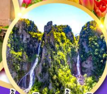
น้ำตกกิ่งกะ-น้ำตกริวเซ