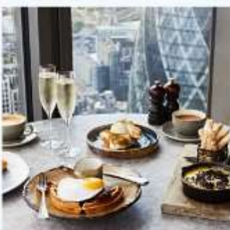
DUCK AND WAFFLE