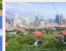
กระเช้าชมเมือง