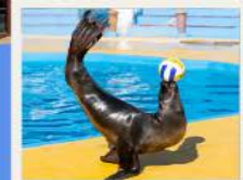
POLAR OCEAN PARK