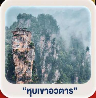
"หุบเขาอวตาร"