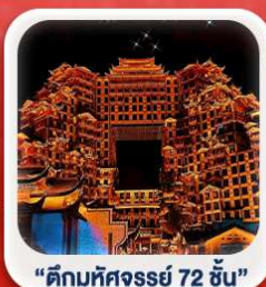
"ตึกมหัศจรรย์ 72 ชั้น"