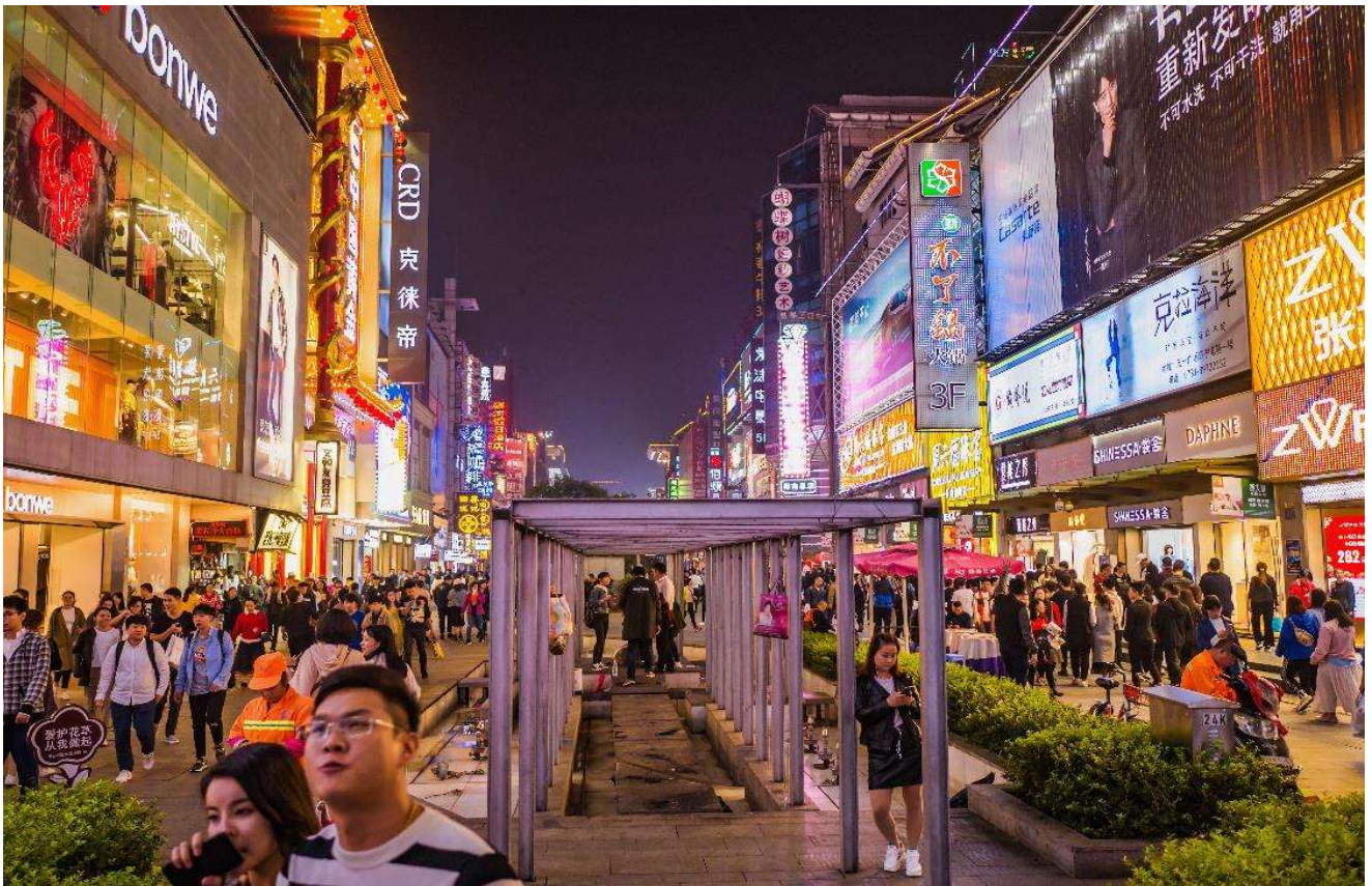
T2G-CSX16SL ZhangJiajie...ฉางซา จางเจียเจีย ฟู่หลงเจิ้น เฟิ่งหวง สะพานแก้ว 6D 5N (SL)