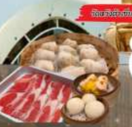
จัดของว่างแถม