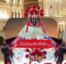
วัดพระธรรมจารี