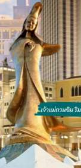
เจ้าแม่กวนอิม ริมทะเล