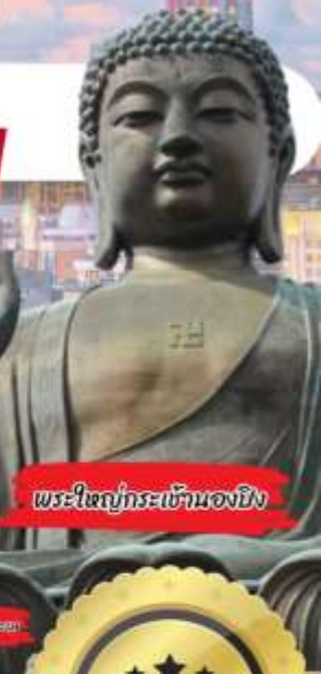
พระใหญ่กระซังทอง