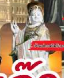
พิพิธภัณฑ์