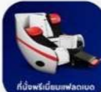
ที่นั่งพรีเมียมเฟลทเบด

บริการอาหารร้อน และ น้ำดื่ม บนเครื่อง ขาไป และ ขากลับ