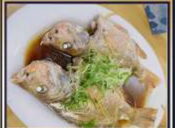
ปลาหนึ่งซีอิ๊ว