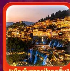
"เมืองโบราณฟูหลงเจิน"