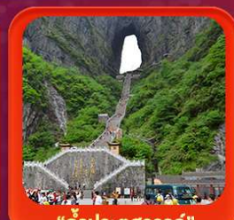
"ถ้ำประตูสวรรค์"