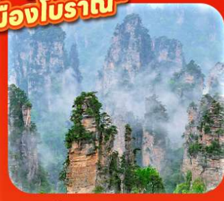
"ภูเขาอวตาร"