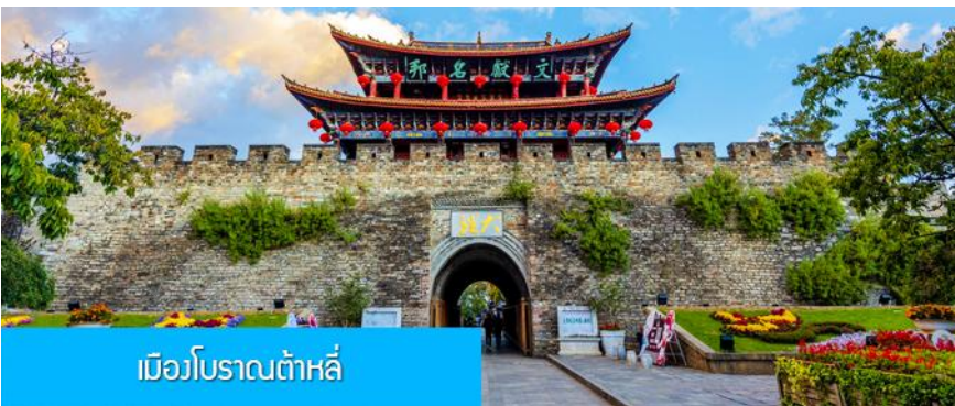
เมืองโบราณต้าลี่

ค่ำ รับประทานอาหารค่ำ ณ ภัตตาคาร (2) หลังอาหารนำท่านเข้าสู่ที่พัก พักที่ DALI ZHUANG YUAN HOTEL ระดับ 4 ดาวหรือเทียบเท่าในเมืองต้าลี่