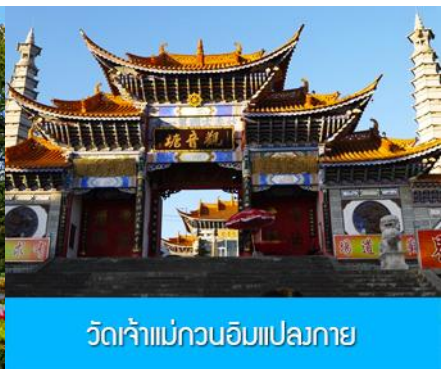
วัดเจ้าแม่กวนอิมแปลงกาย