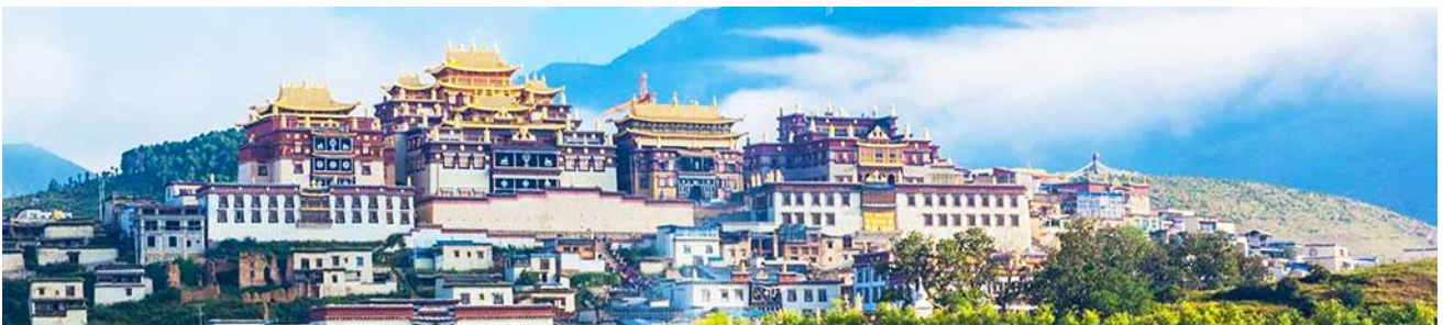
เมืองโบราณเซงกรีล่า