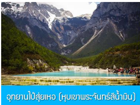
อุทยานปี่สุ่ยเหอ (หุบเขาพระจันทร์สีน้ำเงิน)

หมายเหตุ กรณีที่กระเช้าใหญ่ขึ้นภูเขาหิมะมังกรหยกปิดให้บริการ ด้วยเหตุที่สภาพอากาศไม่เอื้ออำนวย หรือเป็นการปิดเพื่อตรวจสอบสภาพและซ่อมแซมประจำปี ทางทัวร์ขอสงวนสิทธิ์ที่จะจัดโปรแกรมขึ้นกระเช้า ที่จุดชมวิวภูเขาหิมะมังกรหยก ณ สถานีกระเช้าหุยนซานผิง แทน