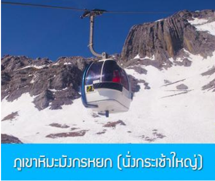
ภูเขาหิมะมังกรหยก (น้ิงกระเข้าใหญ่)

ที่พัก FENG HUANG HOTEL ระดับ 4 ดาว หรือเทียบเท่าเมืองลี่เจียง