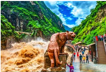
ช่องแคบเสือกะโจน