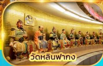
วัดหลินฟาถง