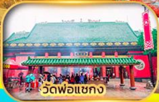
วัดพ่อแชกง