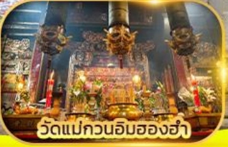
วัดแม่กวนอิมสองข่า