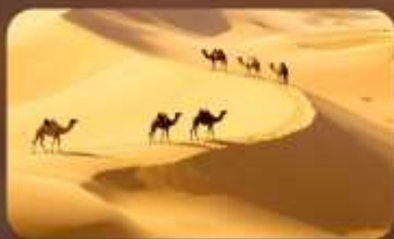
เนินทรายเสียงซาวาน