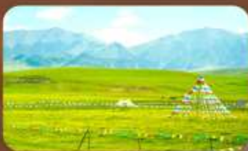
ทุ่งหญ้าออร์คอส