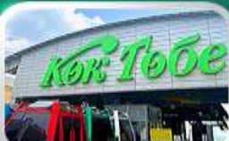
ซิมโทกโทเบซมวิวัลมาตี

นั่งกระเช้าซิมบูลัค • ทะเลสาบโคลไซ • โบสถ์เซมคอฟ