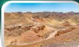
ชารินเกรนด์แคนยอน