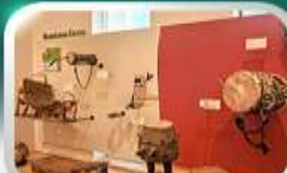
Museum of Folk Instrument