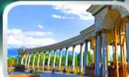
1st President Park