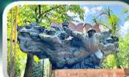
Panfilov Guardsmen Park