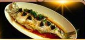
ปลาประรานาบดี