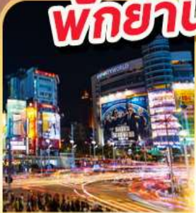
ย่านซีเหมินติง