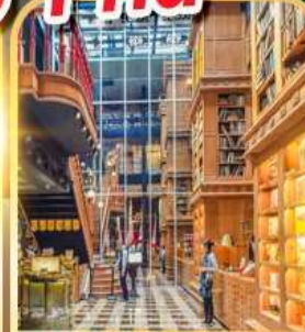
ร้านไอศกรีมมียาฮาระ