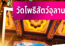
วัดโพธิ์สัตว์อูลาน