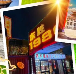
ถนนคนเดินคังบาร์ซี