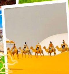
ขี่อูฐชมทะเลทราย