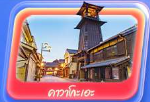
ตาวาโกะระะ