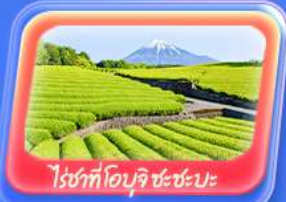
ไร่ชาที่โอบุจิ ชะชะบะ

Highlight สัมผัสความเป็นญี่ปุ่น ชมวิวฟูจิที่ ทะเลสาบยามานากะโกะ ศาลเจ้าฟูจิซังเซเนงงน "Unseen" ขอบพระด้วยหิวโซ่เท้า ที่วัดมัตสึจิยามา โชเดิน ถ่ายภาพวิวไร่ชาที่ โอบุจิ ชะชะบะ ขอบพระ วัดอาซากุสะ วัดพระใหญ่อุซึคุ โตบุทสึ เดินเล่น คาวาโกะระะ Toyosu Senkyaku Banrai ซอปปิงย่านชินจูกุ และห้างไดเวอร์ซิตี