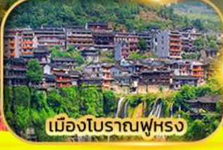
เมืองโบราณฟูหลง