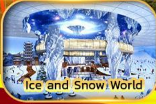
Ice and Snow World