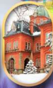
ศาลาว่าการฮอกไกโด