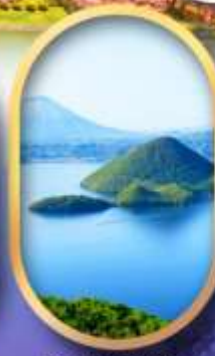
อิวะทะเลสาบโทยะ