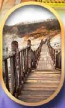
หุบเขาจิกุกดาบิ