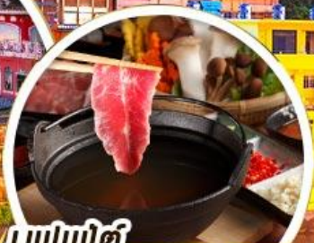
บุฟเฟ่ต์ ซาบูทหม้อไฟไต้หวัน