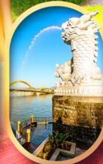
คาร์พดราท้อน