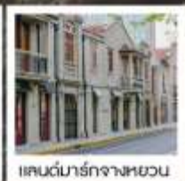
แลนด์มาร์กจางหยวน

เซี่ยงไฮ้ คคลาสสิก ไนท์ / 3 ดึกใหญ่แห่งเซี่ยงไฮ้ คองเรือหมู่บ้านโบราณจูเจียเจียว / EKA Tianwu / วัดหลงหัว แลนด์มาร์ก จางหยวน / ถนนหวยไห่ / ชมโชว์ ERA ที่โรงละครโด่งดังระดับโลก / ซินเทียนตี้