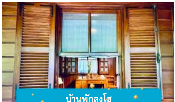
บ้านพักลุงโฮ