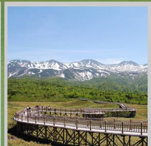
"SHIRETOKO 5 LAKES"