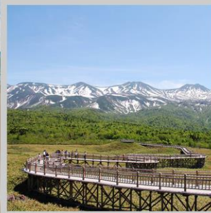
"SHIRETOKO 5 LAKE"