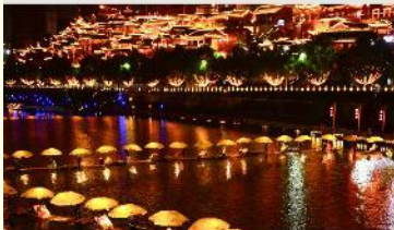
เมืองเซียนเอิน