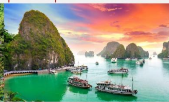
อ่าวฮาลอง

*ทางบริษัทฯ ขอสงวนสิทธิ์ในการสลับโปรแกรมทัวร์ตามความเหมาะสมขึ้นอยู่กับสถานการณ์หน้างาน โดยคำนึงถึงผลประโยชน์ของลูกค้าเป็นสำคัญ