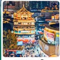
ตลาดตงเหมิน

• ไฮไลท์ OH Bay เป็นแลนด์มาร์คท่องเที่ยวและศูนย์การค้าทันสมัยมีทะเลกวนอูในเซินเจิ้น ขึ้นชื่อเรื่องการช้อปปิ้ง โชคกลาง บารมี ความสำเร็จในการทำงาน