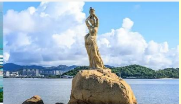
จูไห่ฟิชเชอร์เกิร์ล(หวีหนี่)

*ทางบริษัทฯ ขอสงวนสิทธิ์ในการสลับโปรแกรมทัวร์ตามความเหมาะสมขึ้นอยู่กับสถานการณ์หน้างาน โดยคำนึงถึงผลประโยชน์ของลูกค้าเป็นสำคัญ