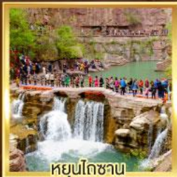
หยุ่นโกซา