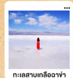
ทะเลสาบเกลือฉาซ่า