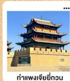
กำแพงเจียยี่กวน