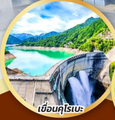
เขื่อนคุโรเบะ