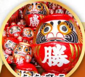
วัดคิตสึโองิ (วัดदारุมะ)

ชมความงามของกำแพงหิมะ เส้นทางสายอัลไพน์ ทากายามา (JAPAN ALPS SNOW WALL)