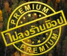
หาดห้าสี