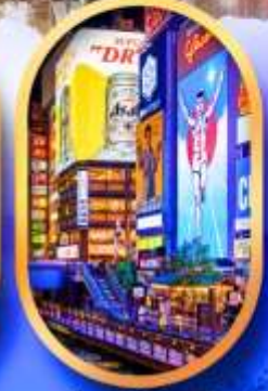
ย่านชิบโฮบาชิ