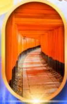
เมืองเก่าทาคายาม่า