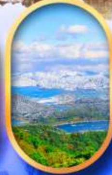
ทะเลสาบมิกะตะ