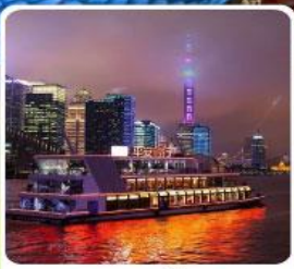
ล่องเรือแม่น้ำหวงผู่