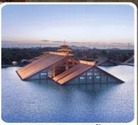
พิพิธภัณฑ์ไต้หน้ำกวงฟู่หลิน