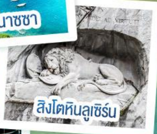
สิงโตหินลูซิิร์น