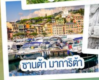
ซานต้า มารีตา