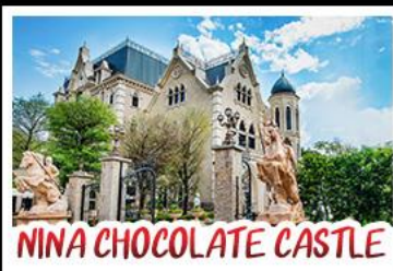
NINA CHOCOLATE CASTLE