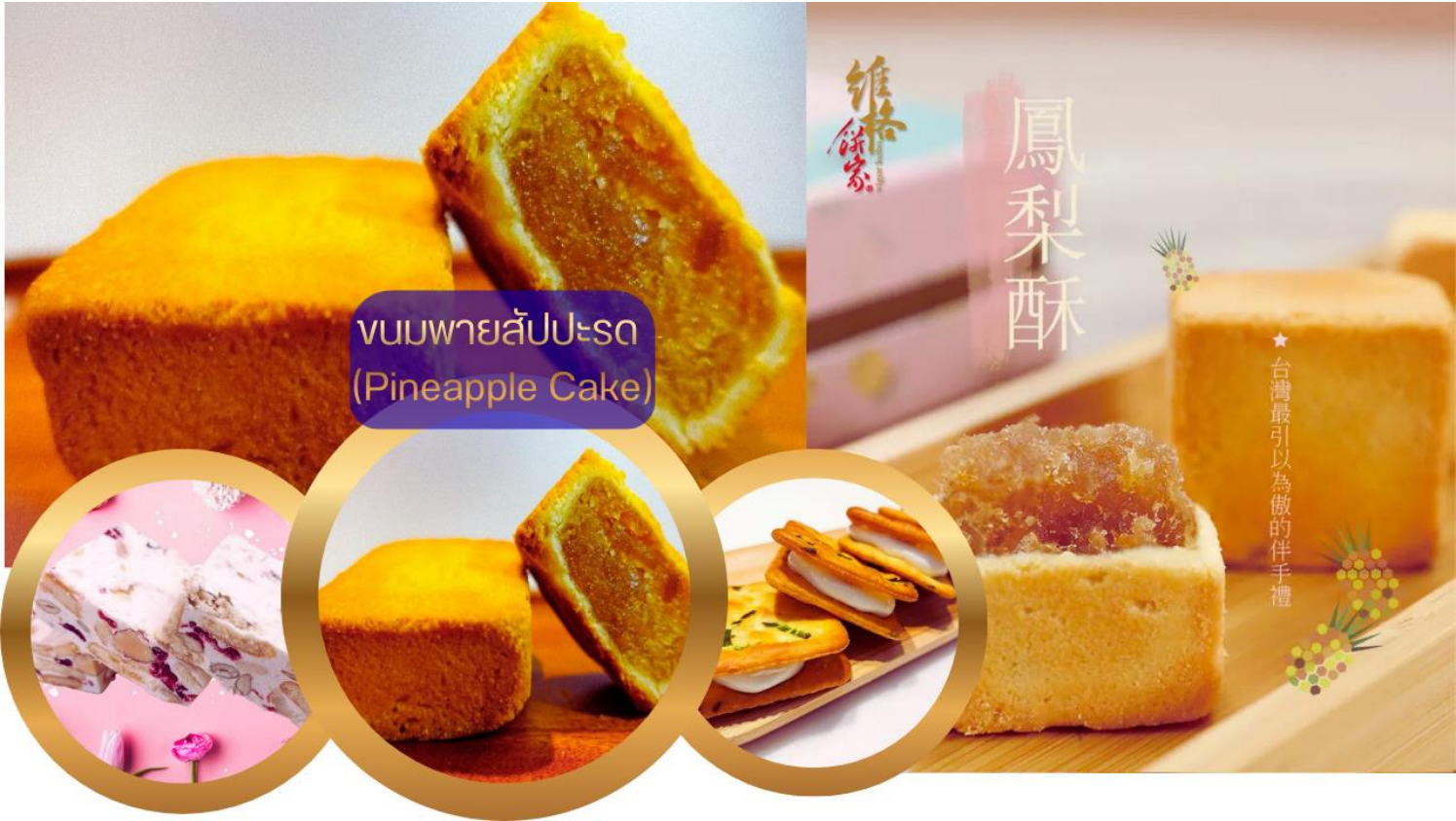
ขนมพายสัปปะรด (Pineapple Cake)