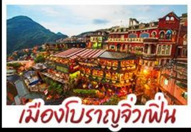
เมืองโบราณจีวเฟิน