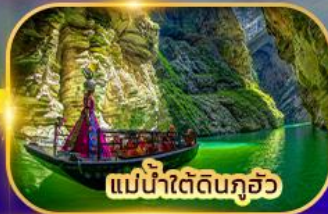
แม่น้ำใต้ดินกุ้ยโจว