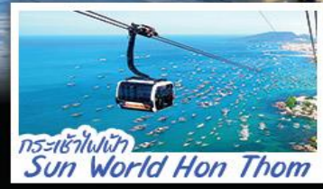
กระเช้าไฟฟ้า Sun World Hon Thom