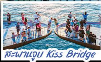
สะพานจูบ Kiss Bridge