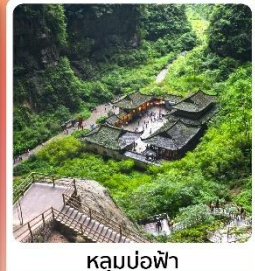
หลุมบ่อฟ้า

ไฮไลท์! เที่ยวอุทยานแห่งชาติหลุมบ่อฟ้า มรดกโลกระดับ 5A ชมรถไฟฟ้าทะเลสาบ อลังการแสงสีที่หงหยาดัง