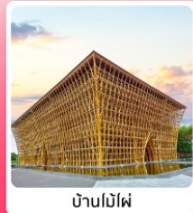
บ้านไม้ไผ่

ไอโอล์ก เที่ยวครบ สวนน้ำ Aquatopia & สวนสนุก Vin Wonder เวนิสแห่งเวียดนาม Grand World Phu Quoc แลนด์มาร์คสุดโรแมนติก