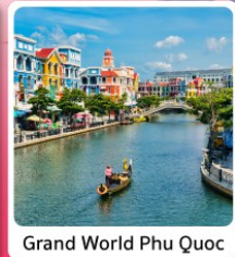
Grand World Phu Quoc