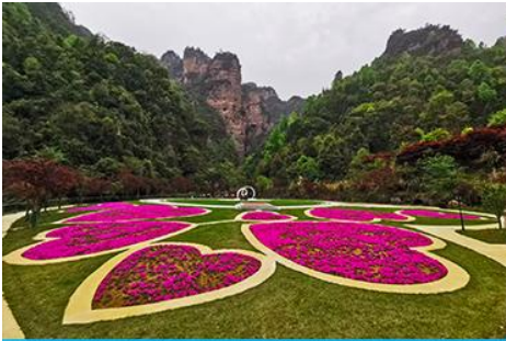
อุทยานฟงเลียนซี