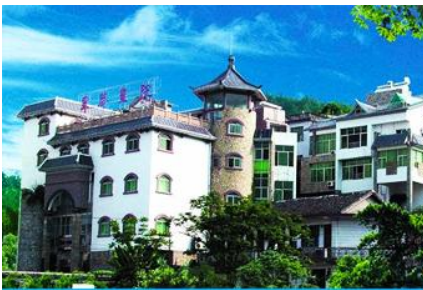
พิพิธภัณฑ์ภาพเขียนหินทราย