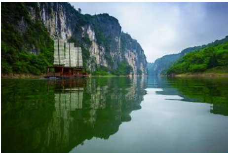
ล่องเรือ เหมาเหยียนเหอ