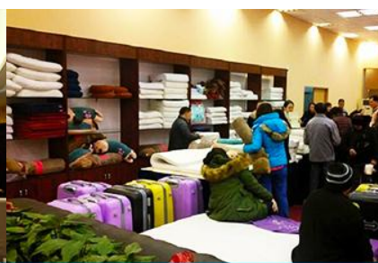
ศูนย์จำหน่ายผลิตภัณฑ์ยางพารา