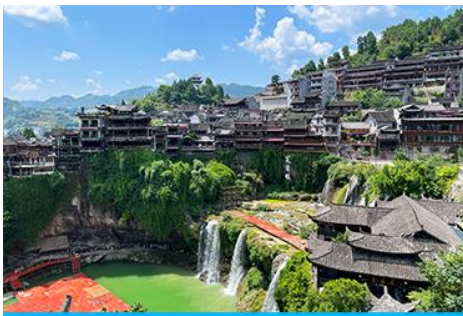
เมืองโบราณ ฝูหรงเจิ้น