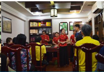
ร้านใบชา