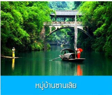
หมู่บ้านซานเสี

พักที่ YICHANG HUIHAO HOTEL โรงแรมระดับ 4 ดาวหรือเทียบเท่าในเมืองหยีซาง