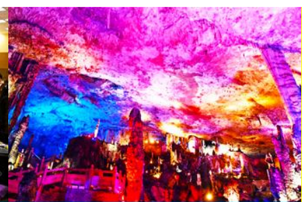
ถ้าเก่าสวรรค์จิวเทียนต้ง

วันที่สาม เมืองจางเจี๋ยเจี๋ย-ศูนย์แพทย์แผนจีน -ศูนย์จำหน่ายผลิตภัณฑ์ยางพารา-ถ้าเก่าสวรรค์-อุทยานฟงเหลียนซี-ล่องเรือธารน้ำหามาเหยียนเหอ-เมืองโบราณผู่หรงเจิ้น