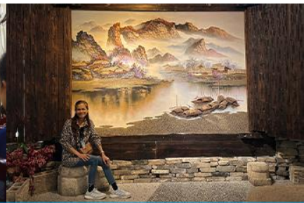
พิพิธภัณฑ์ภาพเขียนหินทราย