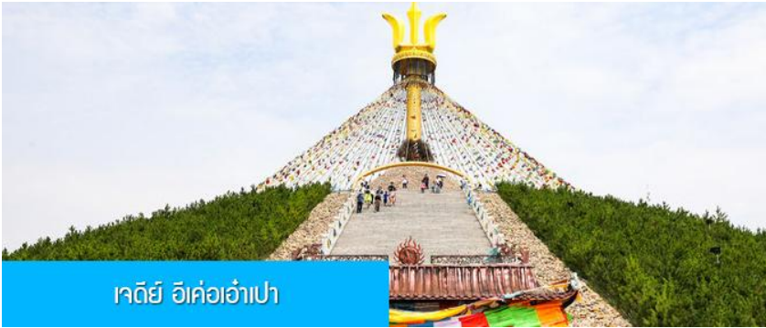
เจดีย์ อี้เค่อเอ้าเป่า

พักที่ DALAETQI SHNAGJING HOTEL โรงแรมระดับ 4 ดาวหรือเทียบเท่าในเมืองด่าลาเท่อ