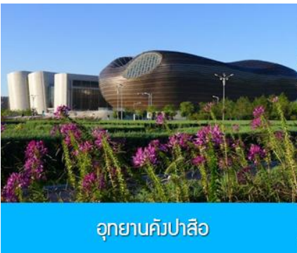
อุทยานคังปาสือ