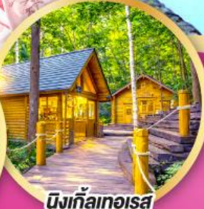
มิงเกิ้ลเกอริส