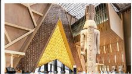
พิพิธภัณฑ์แกรนด์อียิปต์(GEM)

อารยธรรมลุ่มแม่น้ำไนล์ - พีระมิด - อเล็กซานเดรีย - เมมฟิส - ไคโร - โรงแรมระดับ 4 ดาว รวมค่าวีซ่า ทัศนะทะเลทราย - อาหารครบทุกมื้อ