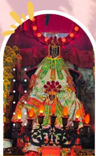
วัดเจ้าแม่กวนอิมฮ่องกง ขอพรเรื่องเงิน ทรัพย์สิน และความมั่งคั่ง