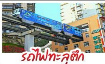
รถไฟทะลุตึก