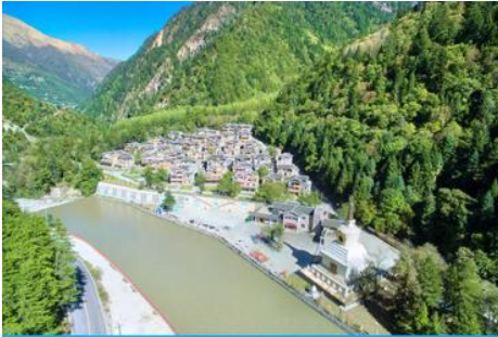
หมู่บ้านทิเบตหยิงหวงฮาเต๋อ

รับประทานอาหารกลางวัน ณ ร้านอาหารพื้นเมือง (8)